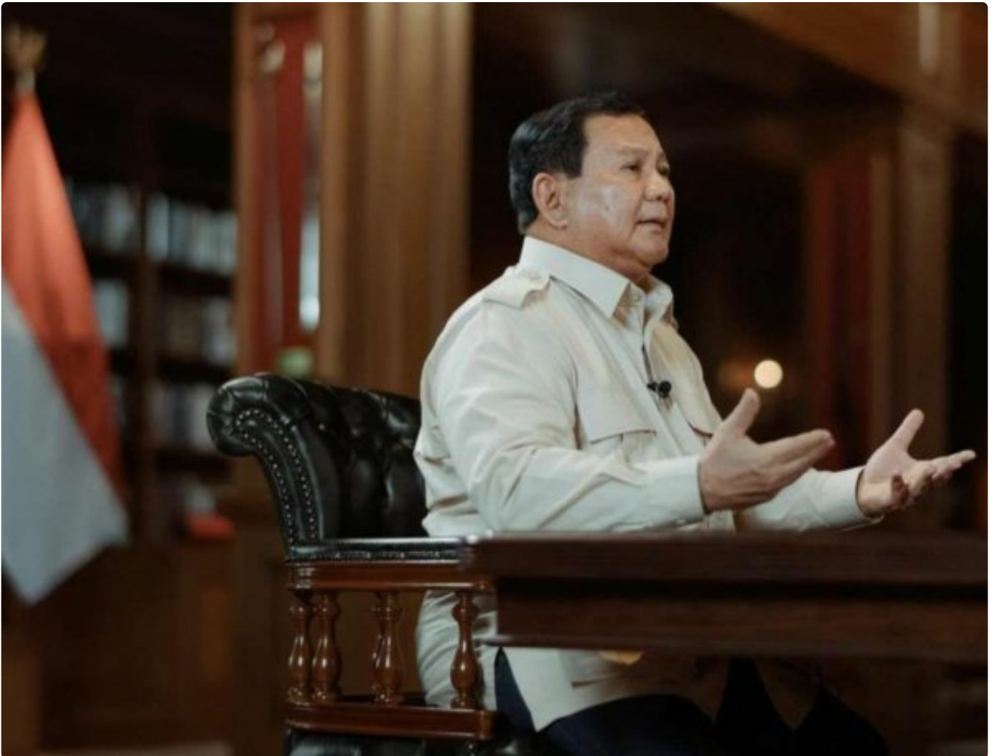
Prabowo Subianto Presiden RI 2024-2029

PENDIDIKAN - Indonesia dikenal sebagai negara yang kaya akan sumber daya alam. Dari hasil tambang yang berlimpah, laut yang luas dengan kekayaan hayati